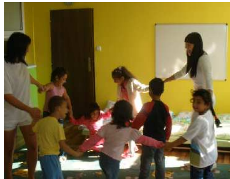
Deti v materskej škole pri hre

Špeciálna materská škola je organizačnou zložkou Spojenej školy internátnej Abovská 244/18, Ždaňa bez právnej subjektivity. Riadi ju riaditeľ Spojenej školy internátnej. Poskytuje poldennú a celodennú výchovu a vzdelávanie deťom so zdravotným znevýhodnením vo veku spravidla od 3 do 7 rokov. Pobyt detí v zariadení sa upravuje podľa pedagogických, hygienických, psychologických a etických zásad. Plní aj diagnostickú funkciu. V spolupráci s odbornými zamestnancami sa aplikujú stimulačné, rozvojové a korekčné programy; realizujú sa špeciálno-pedagogické, logopedické a psychologické intervencie. Vzhľadom na to, že ŠMŠ je organizáciou bez právnej subjektivity, zabezpečujú prevádzku zamestnanci spojenej školy.