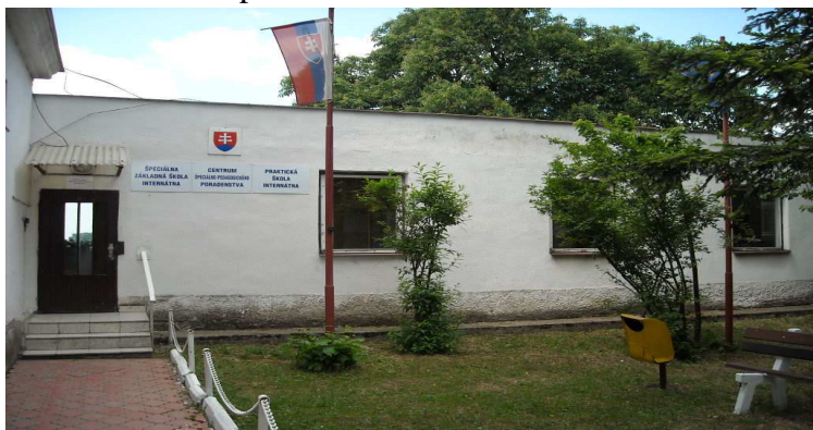
Budova SŠI v Ždani

16.9.1996 sa mení zriaďovateľ. Stáva sa ním Krajský úrad Košice. Rozhodnutím Krajského úradu v Košiciach zo dňa 13. septembra 2000 sa Osobitná škola internátna mení na Špeciálnu základnú školu internátnu. 1. januára 2004 opäť nastáva zmena zriaďovateľa, ktorým je Krajský školský úrad v Košiciach. V tom istom roku je pri škole zriadená Špeciálno-pedagogická poradňa, dnes Centrum špeciálno-pedagogického poradenstva. 1. januára 2006 pribudla Praktická škola internátna a v septembri roku 2009 získavame novú podobu.