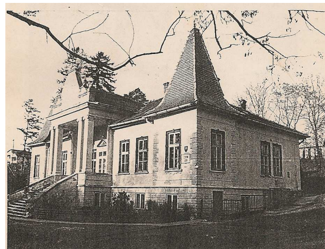
Kaštieľ v Skároši