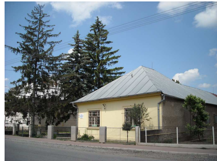
Alokované triedy v Čani

Havarijnú situáciu na budove školy v Skároši sme pre nedostatok finančných prostriedkov nemohli odstrániť. Zákaz prevádzkovania sme riešili presťahovaním tried zo Skároša do Ždane, kde sa vyučovalo aj popoludní. Za pomoci Obecného úradu v Čani sme zrekonštruovali budovu bývalej materskej školy v Čani, do ktorej sme triedy druhej zmeny zo Ždane presťahovali.